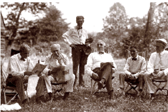
5) Camping (1921), de gauche à droite :