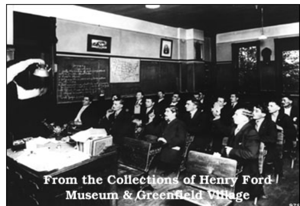
4) La leçon d'anglais à Highland Park