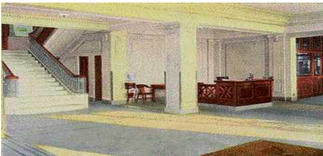
3) Les bureaux d'Highland Park (1914)