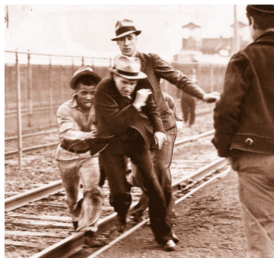
6) La « sécurité » poursuit un syndicaliste