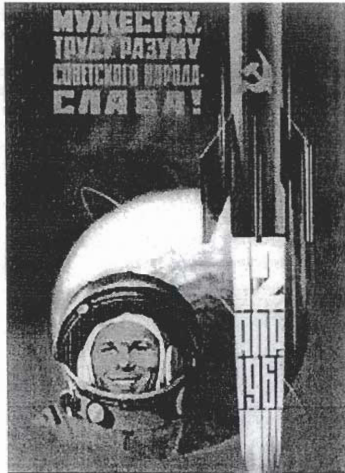
Affiche soviétique de 1961: « Gloire au courage, au travail et à l'intelligence du peuple soviétique. 12 Avril 1961 ».