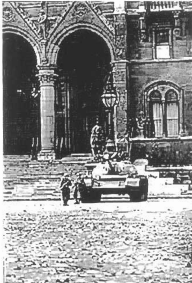
Un char soviétique devant le Parlement hongrois.